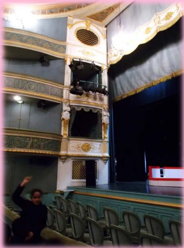
La loge royale