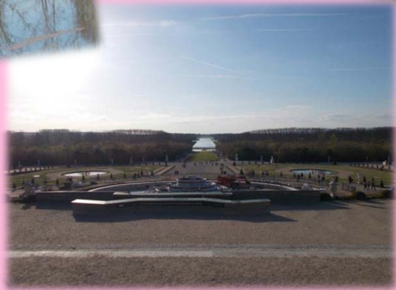
Les fontaines des Grandes Eaux