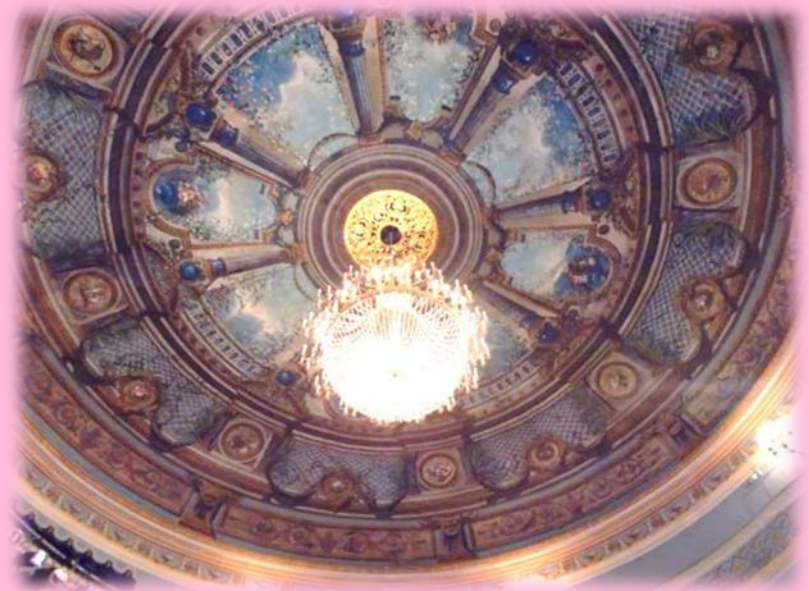
Le somptueux lustre